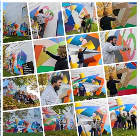
Mural "Jardín Refugio"